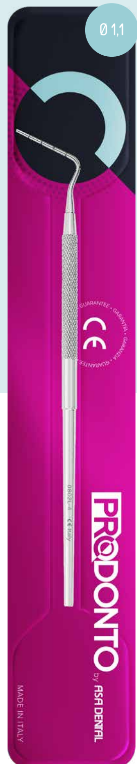
Otturatore per canali