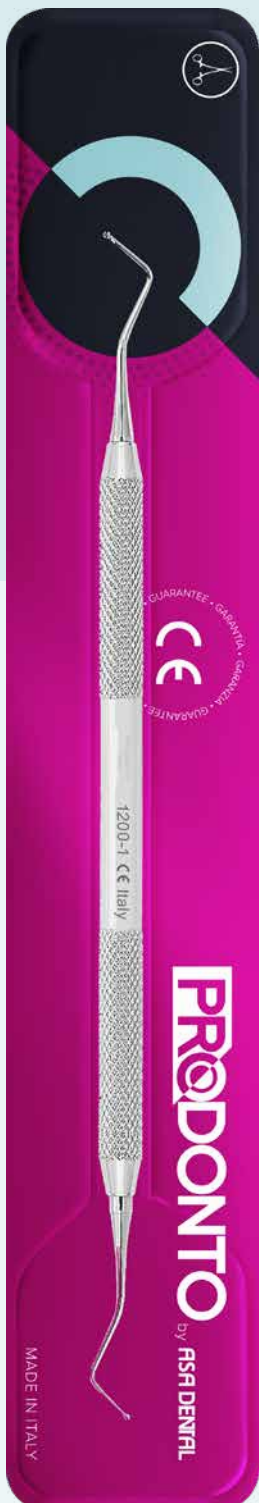
Otturatore doppio pallina