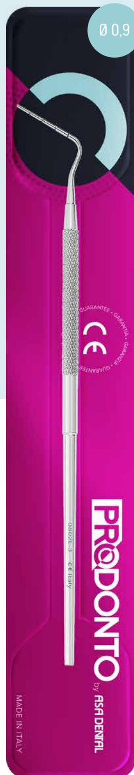
Otturatore per canali