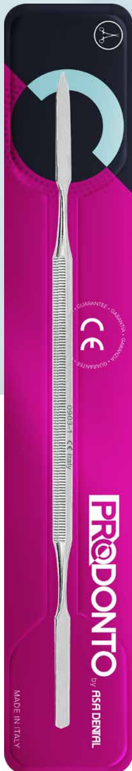
Spatola per cemento doppia