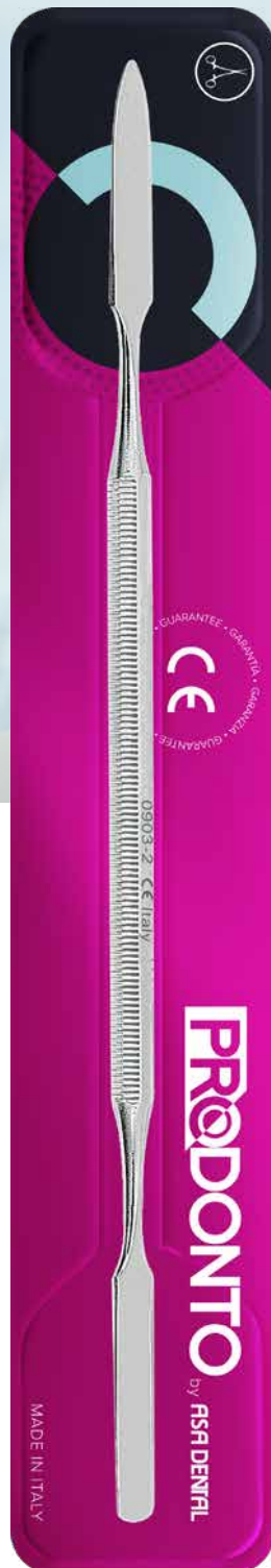
Spatola per cemento doppia