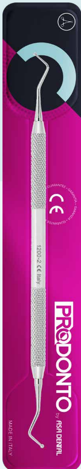
Otturatore doppio pallina