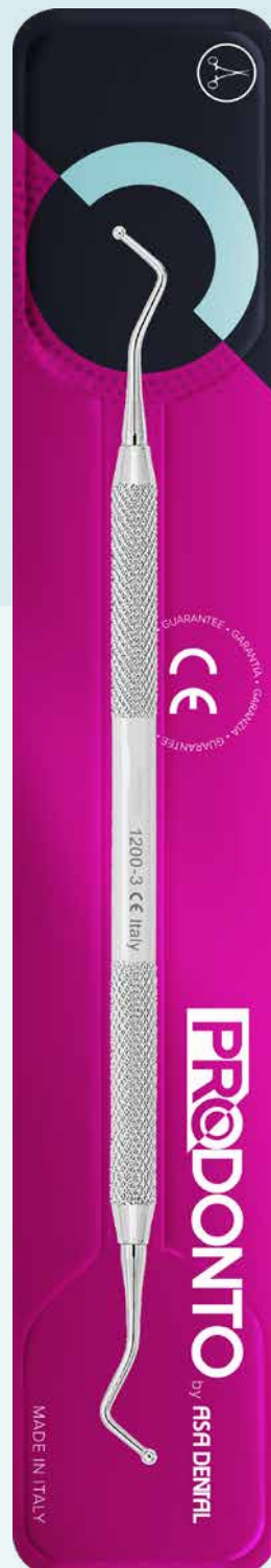
Otturatore doppio pallina