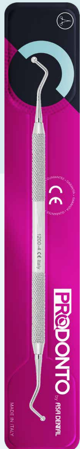
Otturatore doppio pallina