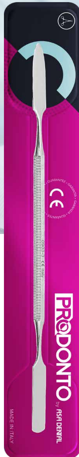
Spatola per cemento doppia