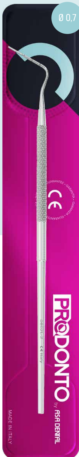
Otturatore per canali